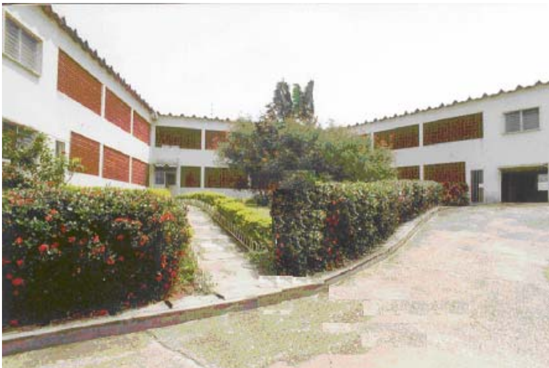
CASA DELLA COMUNITÀ SALESIANA