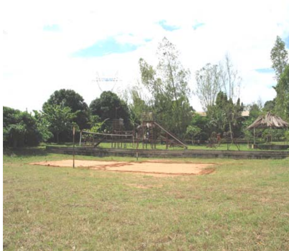
CAMPO DI PALLAVOLO