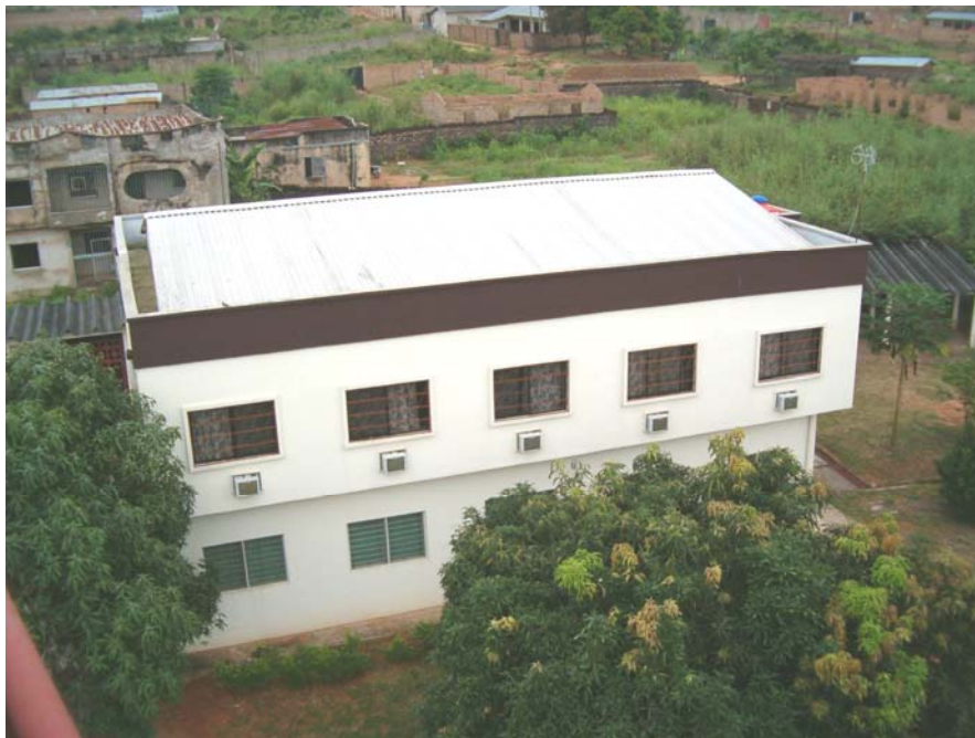
CASA "ATTILIO GIORDANI" per ospiti e volontari Pian terreno: Cucina, Salone - Primo Piano: Camere