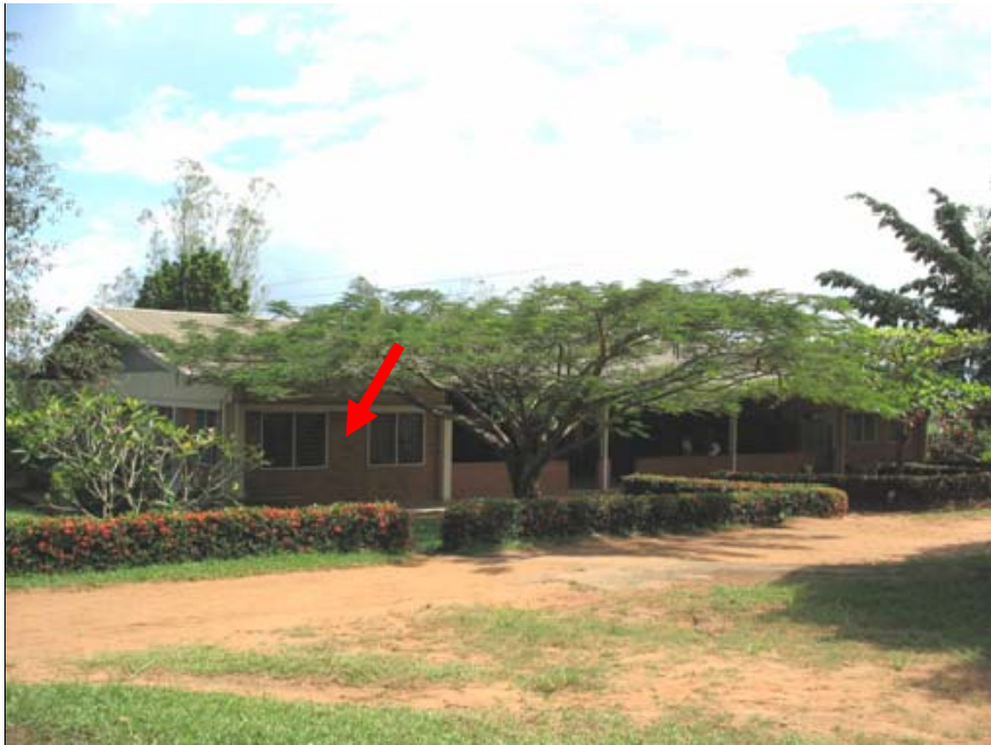
SALONE MULTIUSO: CyberCafé (indicato dalla freccia)