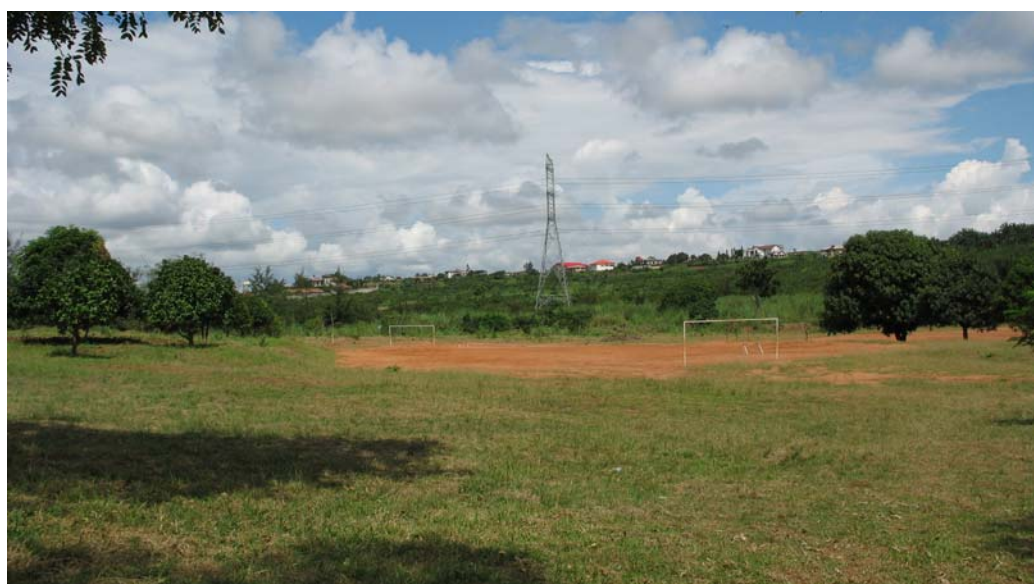
CAMPI DI CALCIO