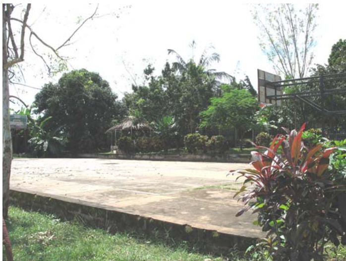
CAMPO DI PALLACANESTRO